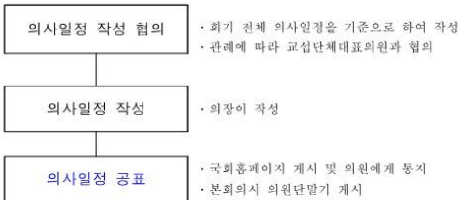
<그림 IV-3> 당일 의사일정 작성과정