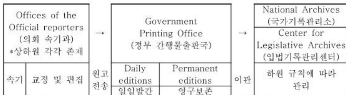
[표 40] 미국 의회회의록의 생산 및 보존 절차

의회회의록의 보존 관련 규정은 하원 의사규칙 제7장 18) 과 96대 의회의 상원 결의안 474 19) 에 근거하고 있다. 하원 의사규칙 제7장은 “각 위원회 및 하원의 기관장은 매 의회를 기준으로 생산된 기록물을 사무총장에게 이관해야 한다” 및 “사무총장은 제1조에 따라 이관된 기록물 및 여타 종래의 기록물을 국가기록물관리소에 이관하여 보존하게 하여야 한다.”라고 명시하고 있다. 국가기록물관리소 산하 입법기록관리센터에 이관된 기록물은 하원 규칙에 따라 관리된다.