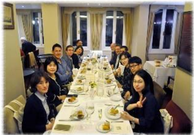
(farewell dinner에 참석한 한국 대표단 )