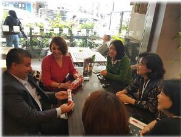
(터키 의회 속기사들과)