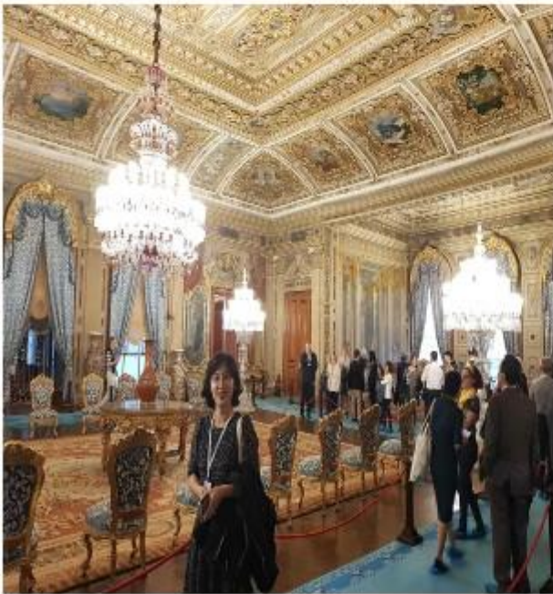
(돌마바흐체 궁전 내 국무회의장 모습)

또한 돌마바흐체 궁전은 일반 관광객 관람 시 사진 촬영금지구역이다. 하지만 Intersteno 터키 그룹 측의 사전 준비로 대통령궁 안내직원의 해설과 함께 사진촬영도 허가해 줘서 화려하고 신기한 물건이 가득한 궁전의 모습을 마음껏 촬영할 수 있었다. 행사를 준비한 Intersteno 터키그룹 측에 감사함을 전하고 싶다.