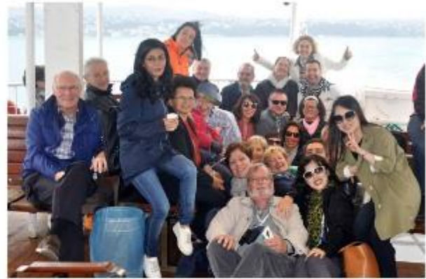
(All-Day Excursion에 참가한 한국대표단과 각국 회원들)