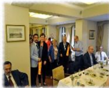
(인터스테노 회의 터키 그룹 측에 선물 전달)