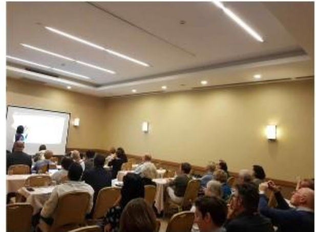
(IPRS Meeting 주제 발표 중)