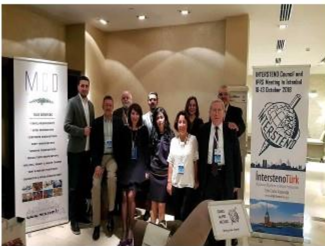
(개최국인 Intersteno Turkey Group)

이번 행사 개최지는 터키의 이스탄불이었다. 개최 도시에 대한 결정은 독일 베를린에서 2017년 7월에 개최된 제51차 Intersteno 총회에서 결정되었다. 행사 시작은 Holiday Inn Sisli Hotel에서 참가자 등록이 시작되었다. Intersteno 터키그룹에서는 에코백에 회의 일시 및 행사 세부일정표, 참가자 이름표, 터키 전통 기념품인 나자르 본주, 터키식 디저트 등을 웰컴 선물로 준비하여 우리 한국대표단을 따뜻하게 환영해 주었다. Intersteno 터키그룹의 세심한 배려에 이번 행사 준비에 얼마나 노력했는지 알 수 있었다. 우리 대한민국 대표팀도 그에 화답하여 준비해 간 대한민국 전통무늬로 된 파우치를 행사 개최팀과 참가 회원들에게 기념품으로 선물하였다.