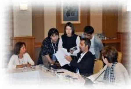
(터키 대표에게 세부일정 문의)