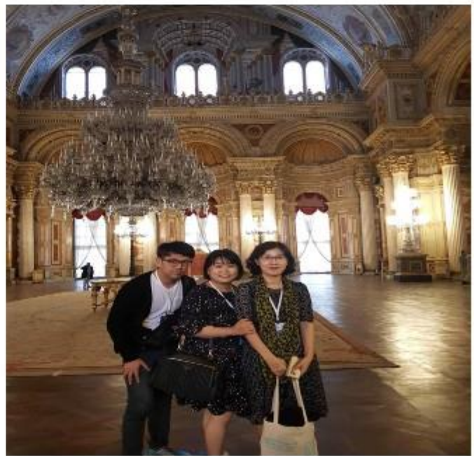
(국민 방문 시 환영행사 개최하는 대연회장)