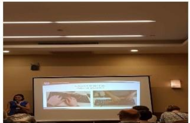
(터키의 F-Keyboard 교육방법에 대해 주제 발표 중)