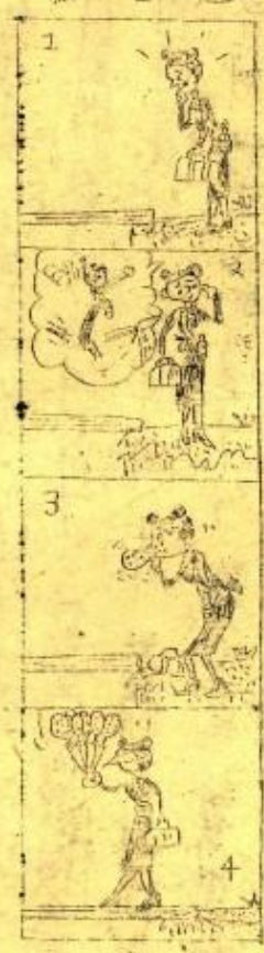
四心. 四 (細心注意)